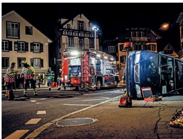
Bei einem Unfall mit Verletzten zählt jede Sekunde.

aj. Das Zusammenspiel zwischen Mensch, Technik und Taktik muss funktionieren, wenn der Ernstfall eintritt. Dafür spielt die Stützpunkt Feuerwehr Küssnacht (SFK) regelmässig Übungsszenarien durch. Die diesjährige Hauptübung war soweit anspruchsvoll und speziell, als dass sie mitten im Dorf und vor viel Publikum durchgeführt wurde. Letzte