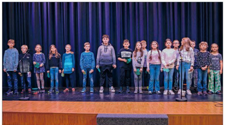
Diese Schulklasse sang dem Verein ein Ständchen zum Jubiläum.