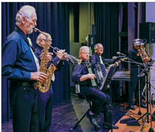
Das Sunnehof-Quintett liess richtige Partystimmung aufkommen.